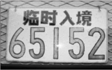
In China musste Merchi diese Nummer zusätzlich tragen

Sie muss eine Menge Papierkram regeln und bekommt einen zeitweiligen chinesischen Führerschein und ein chinesisches Nummernschild. Ihre Autonummer TF 8686 U sorgt für Aufregung; die 8 bedeutet in China Glück und die 6 Triumph. Beide Zahlen gleich zwei Mal!