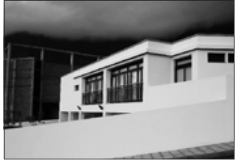
Das neue Heim, neben dem Sportstadion mit dem eingestürzten Dach, an der Calle Isla La Palma in Tigaday gelegen.

Regierung zusammen eine Studie erstellen, aus der hervorgeht, wie und unter welchem Namen dieses für Hierro's Sozialdienste wichtige Werk später bewirtschaftet werden soll ... Ruedi