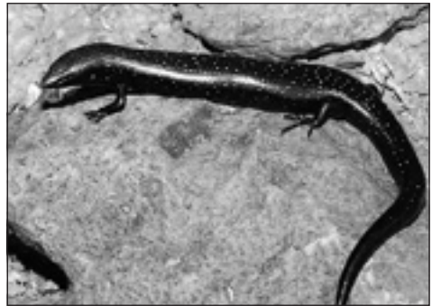
La Lisa de La Gomera: Chalcides coeruleopunctatus