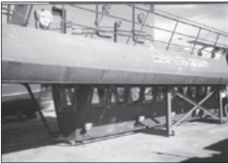
Im Trockendock La Restinga

Vor fast zwei Jahren las ich in der Cabildohochglanzbroschüre die Ankündigung, dass El Hierro, zukunftsweisend wie immer auf den Kanaren, ein Glasbodenboot braucht, um den doch sooo zahlreichen Touristen Pancho und andere Sehenswürdigkeiten unter Wasser zu zeigen. Kostenpunkt rund 440.000 Euro. Bestimmt für La Restinga. Und wo soll das Boot fahren? In der Recreationszone, dem Naturschutzgebiet im Meer, vielleicht?