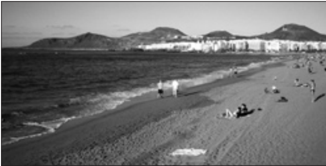
Playa de las Canteras, Las Palmas

Schnorchler sind begeistert: Rochen, Doraden, Seezungen, Algenpflanzen und Tintenfische. Drei Kilometer Strandpaß, gesäumt von einem lebhaften Paseo, mit allem, was der Sonnenbader braucht. Die Playa de las Canteras weist eine exzellente Servicedichte auf: Duschen, Schließfächer, WC's, Gratis-Aschenbecher.